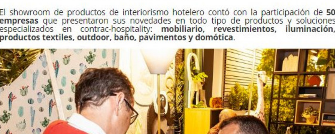
El showroom de productos de interiorismo hotelero contó con la participación de 50 empresas que presentaron sus novedades en todo tipo de productos y soluciones especializados en contract-hospitality: mobiliario, revestimientos, iluminación, productos textiles, outdoor, baño, pavimentos y domótica.

Con esta edición en Madrid, InteriHotel se reafirma como un evento generador de negocio: un total de 465 de los profesionales inscritos acudían con motivo de una próxima reforma o nueva construcción de hotel.